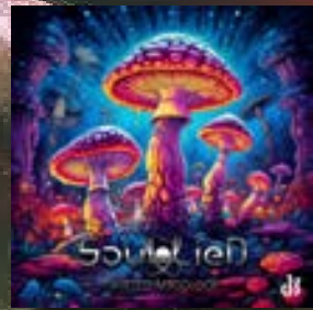
Soul Lied Twisted Mycology Lab Records