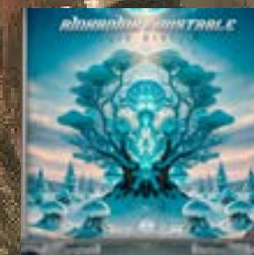
Unstable, Rinkadink Acid Winter 360 Music Mx