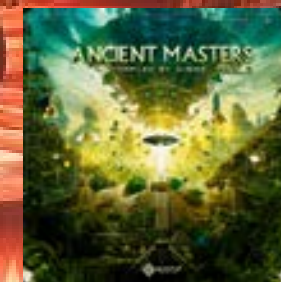
Jhesha & X-Side Master Blasters Quantum Sorcery Records