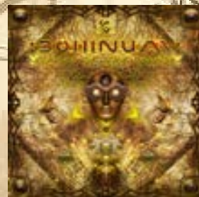
Bohinum Planck Theory Twenty-five Records