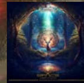
Space Venado Fueguito en el Corazón Astral Vision Records