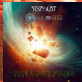
Stardust & Soul Mates Cosmic Wisdom Astral Vision Records