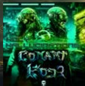
Conami Kode Planet Irk New Skull