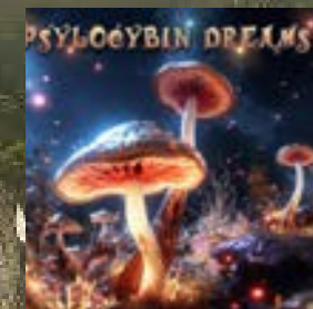
Arcek Psylocybin Dreams Multidimensional Music